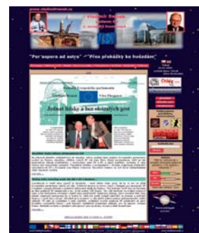
Původní vzhled stránek