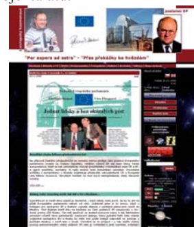
Nový vzhled stránek

Doufám proto, že se Vám nová podoba stránek www.vladimirremek.cz bude líbit a pro ilustraci Vám nabízím srovnání původní a inovované verze. V. Remek