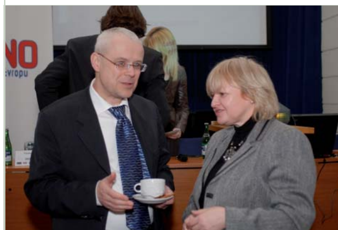
Europoslankyně Věra Flasarová s komisařem EU Vladimírem Špidlou na březnové konferenci věnované Evropské unii v Ostravě.