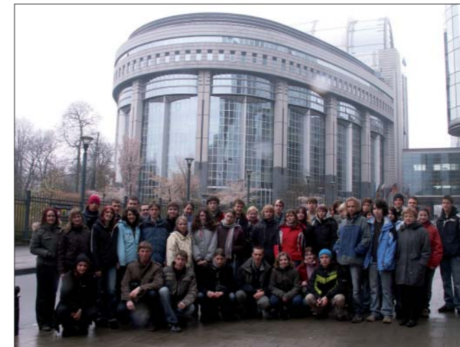
Studenti Dvořákova gymnázia Kralupy nad Vltavou na návštěvě EP v Bruselu na pozvání europoslance V. Remka

Filmový štáb německé společnosti „Mediopolis film“ z Lipska natáčí v současné době dokument o osudech kosmonautů z projektu pilotovaných letů programu Interkosmos. Dokument je spolufinancovaný z evropských prostředků na podporu dokumentární tvorby a představí životní osudy deseti kosmonautů z bývalých socialistických zemí, kterým tehdejší Sovětský svaz nabídl účast na kosmických pilotovaných letech. Natáčení probíhá například jak v Německu, Polsku, Mongolsku a dalších zemích, tak také třeba i v Belgii, kde filmaři zaznamenali současné působení prvního československého kosmonauta a poslance EP Vladimíra Remka. Při té příležitosti natáčeli i besedu se studenty Dvořákova gymnázia z Kralupy nad Vltavou, kteří byli v EP v Bruselu na jeho pozvání. Záměrem dokumentu je ukázat i aktuální uplatnění kosmonautů. Vedle spolufinancování z prostředků Evropské filmové nadace se na přípravě ojedinelého filmového dokumentu podílejí také televizní společnosti z Polska, Belgie atd. a štáb bude natáčet i ve Hvězdném městečku v Moskvě.