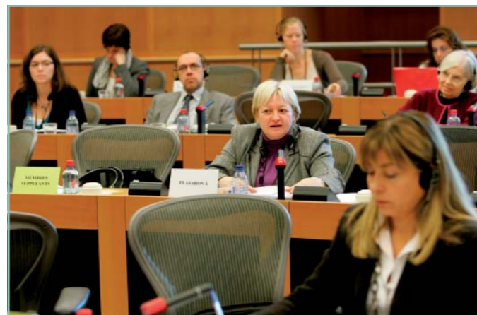
Věra Flasarová vystupuje se svým příspěvkem na zasedání Výboru pro práva žen a rovné příležitosti v Evropském parlamentu.

Na sérii společných setkání s občany Ostravy se 16. září sešli europoslanci Věra Flasarová a Vladimír Remek v Ostravě. Program zahájili tiskovou konferencí se severomoravskými novináři v ostravském hotelu Imperiál. Odpoledne patřilo akci, která nesla název Drakiáda a ohlašovala příchod podzimu i s tradičním pouštěním draků. Nepříznivé počasí s deštěm ale nakonec zahnal všechny účastníky pod střechem nákupního střediska Interspar v Ostravě-Porubě, kde proběhla autogramiáda, na níž oba poslanci EP desítkám zájemců podepisovali své publikace a fotografie. Večer se Vladimír Remek s Věrou Flasarovou zúčastnili ještě setkání s občany na porubském zámečku.